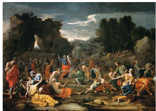
図1 ニコラ・プッサン 《マナの収集》

この博識な画家〔プッサン〕は、自らが真の詩人 un véritable Poète であり、劇作において観察されるような、詩法が求めている諸規則を遵守して作品を構成していることを示したのである。というのも、自分が扱う歴史＝物語 l'Histoire を完璧に表象するためには、不幸から幸福へと状況を移動させるために、詩人が必要とする多くの部分が不可欠だからである。このようなわけで、多様な行動をおこなっている人物の集団はペリペテイア Peripeties と呼ばれているものに奉仕する挿話 Episodes であり、極度の不幸からより幸福な状態に移ろうとするイスラエルの民に生じた変化 le changement を知らしめるための手段なのである 11 。